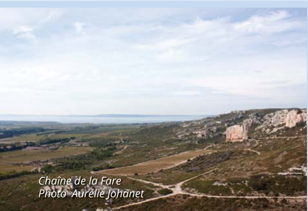
Chaîne de la Fare