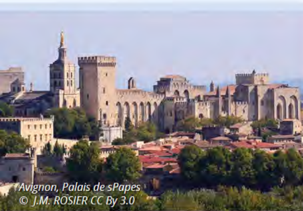
Avignon, Palais de sPapes