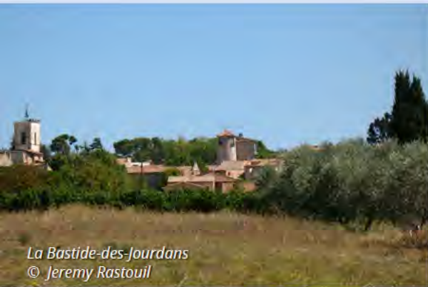
La Bastide-des-Jourdans