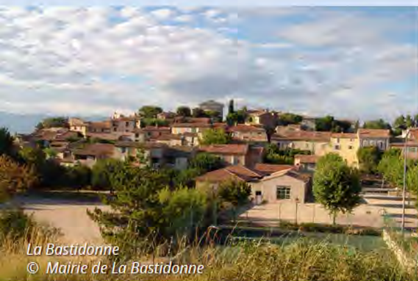
La Bastidonne