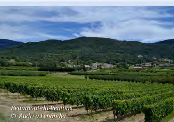
Beaumont-du-Ventoux © Andrea Fernández