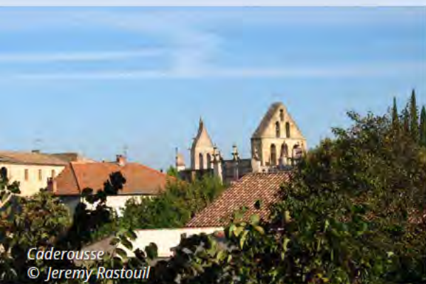
Caderousse © Jeremy Rastouil