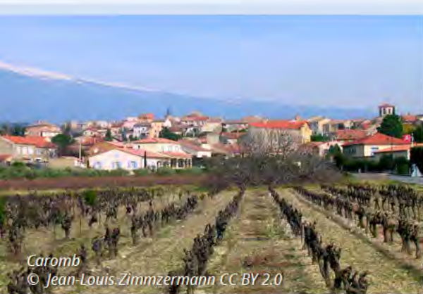
Caromb © Jean-Louis Zimmzermann CC BY 2.0