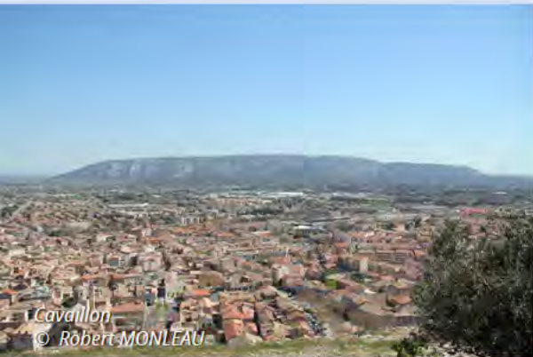
Cavillon © Robert MONLEAU