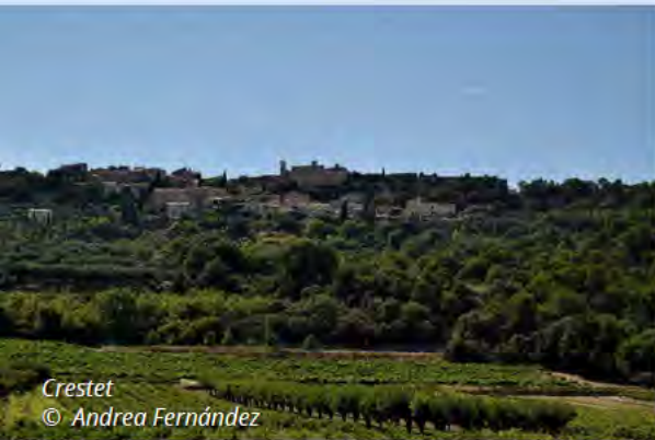
Crestet © Andrea Fernández