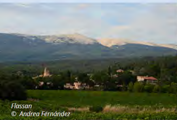
Flassan © Andrea Fernández