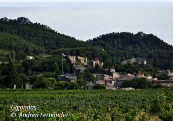
Gigondas © Andrea Fernández