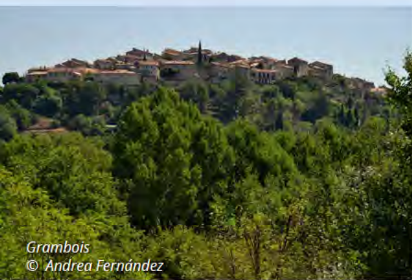
Grambois © Andrea Fernández