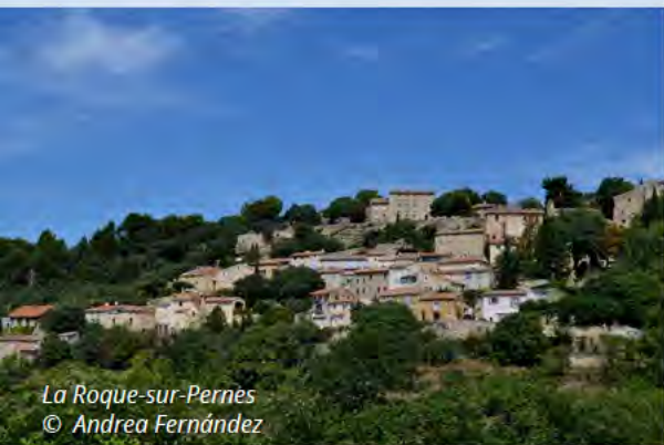
La Roque-sur-Pernes