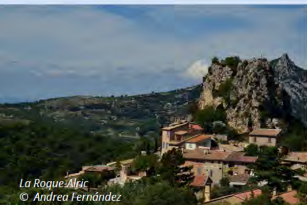
La Roque-Alric