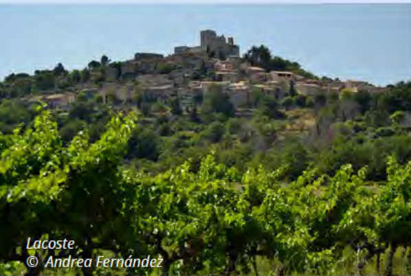
Lacoste, © Andrea Fernández