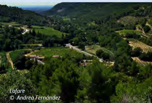
Lafare © Andrea Fernández