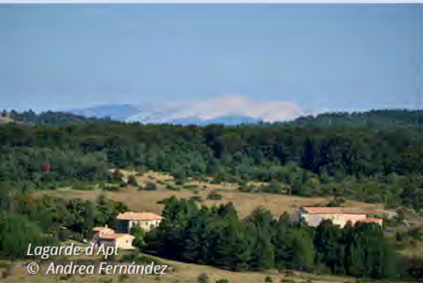
Lagarde-d'Apt © Andrea Fernández