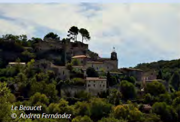
Le Beaucet © Andrea Fernández