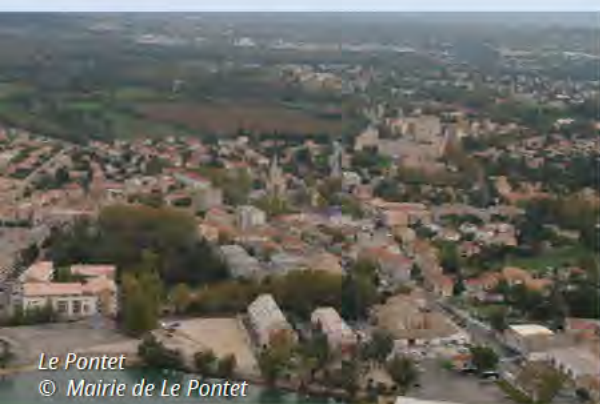
Le Pontet