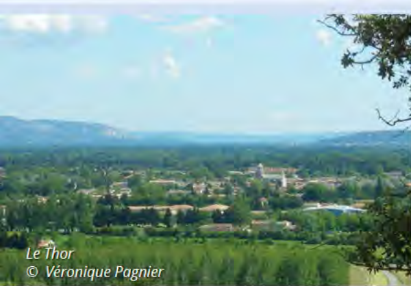
Le Thor