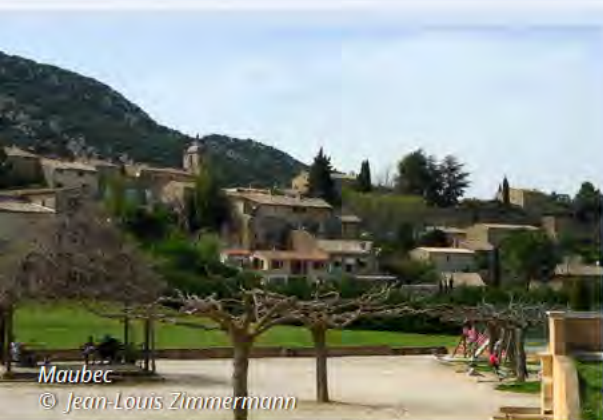
Maubec © Jean-Louis Zimmermann