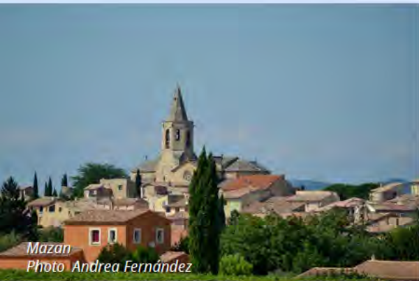
Mazan Photo Andrea Fernández