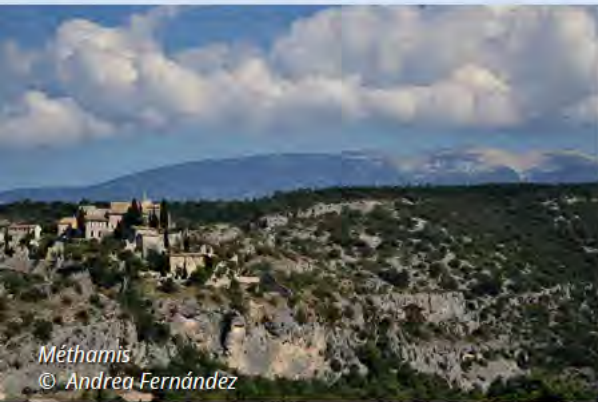
Méthamis © Andrea Fernández