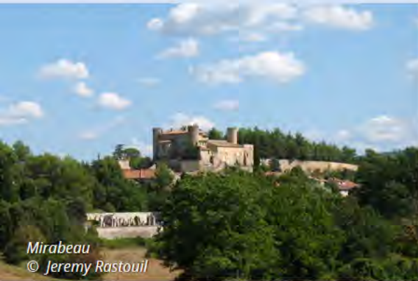
Mirabeau © Jeremy Rastouil