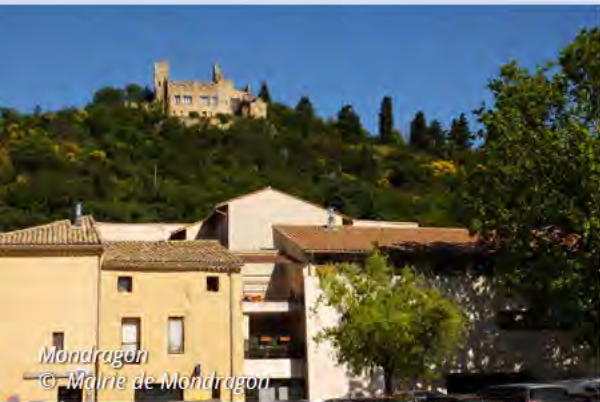
Mondragon © Mairie de Mondragon