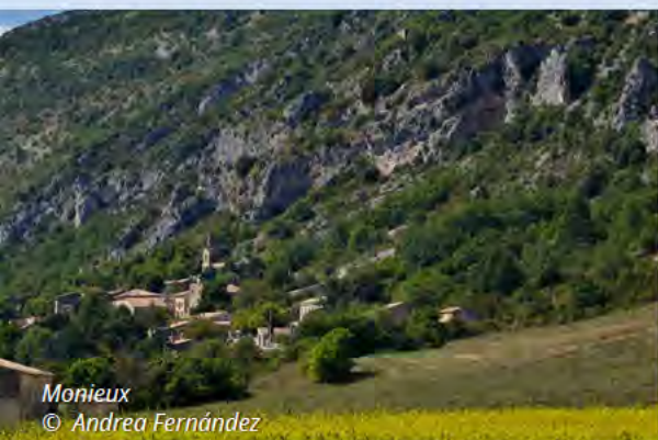
Monieux © Andrea Fernández