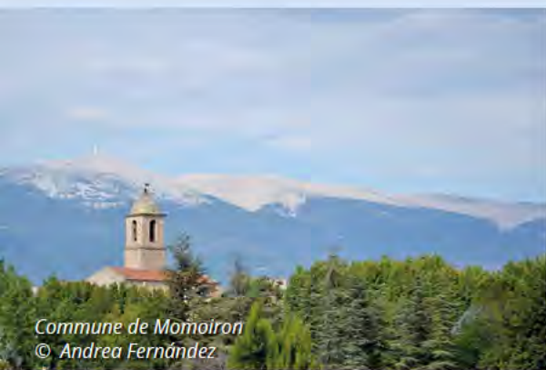
Commune de Mormoiron