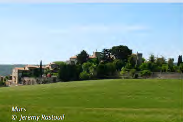
Murs © Jeremy Rastouil