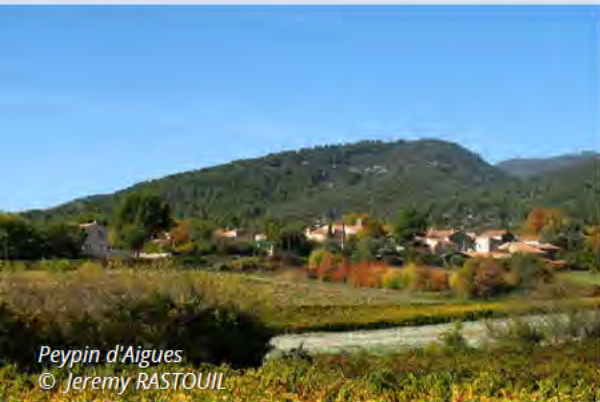
Peypin d'Aigues