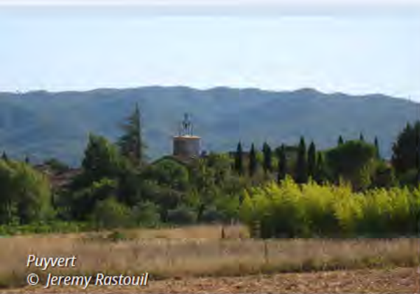
Puyvert © Jeremy Rastouil