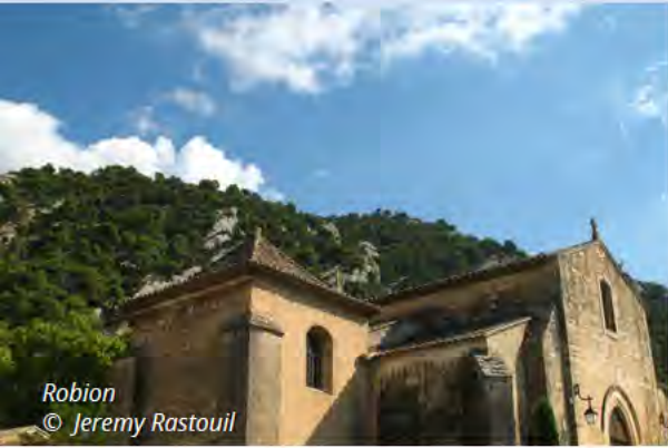
Robion © Jeremy Rastouil