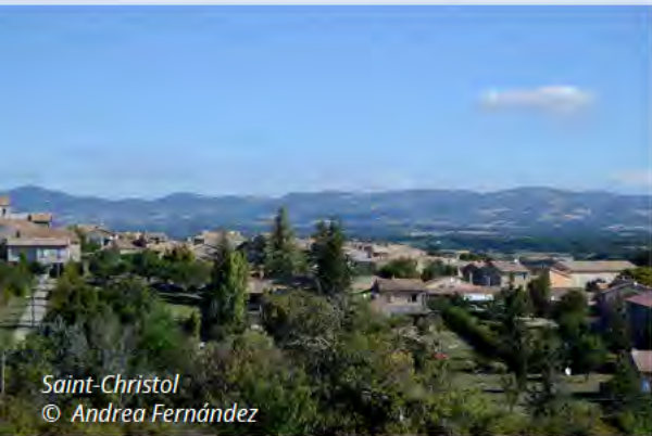
Saint-Christol © Andrea Fernández