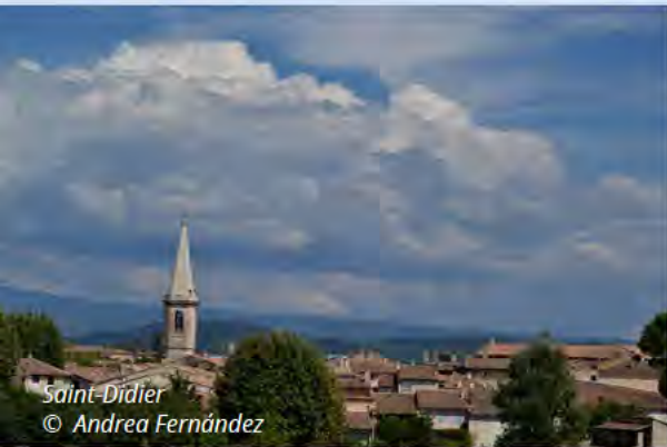
Saint-Didier © Andrea Fernández