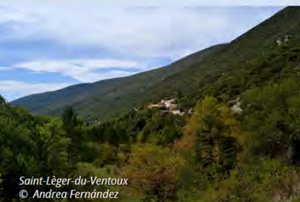
Saint-Léger-du-Ventoux © Andrea Fernández