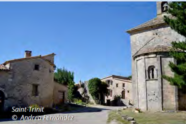
Saint-Trinit © Andrea Fernández