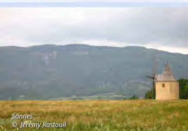
Sannes © Jérémy Rastouil