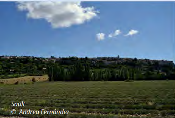
Sault © Andrea Fernández