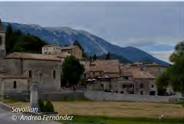
Savoillan © Andrea Fernández