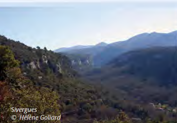
Sivergues © Hélène Goliard