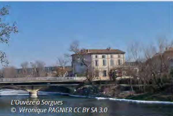
L'Ouvèze à Sorgues