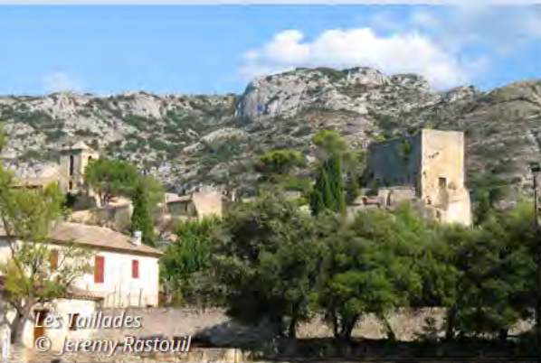
Les Taillades