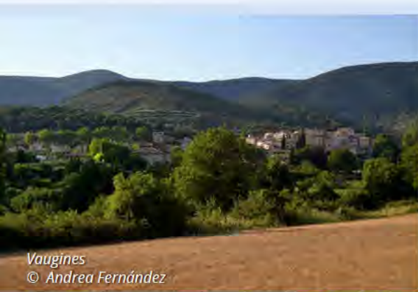
Vaugines © Andrea Fernández