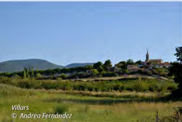
Villars © Andrea Fernández