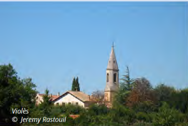
Violès © Jeremy Rastouil