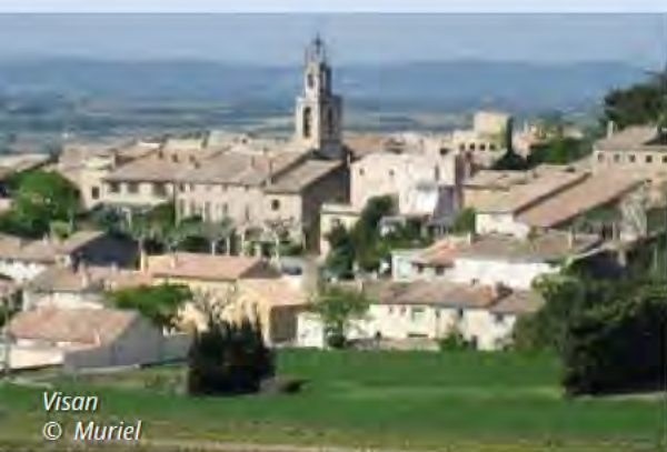
Visan © Muriel