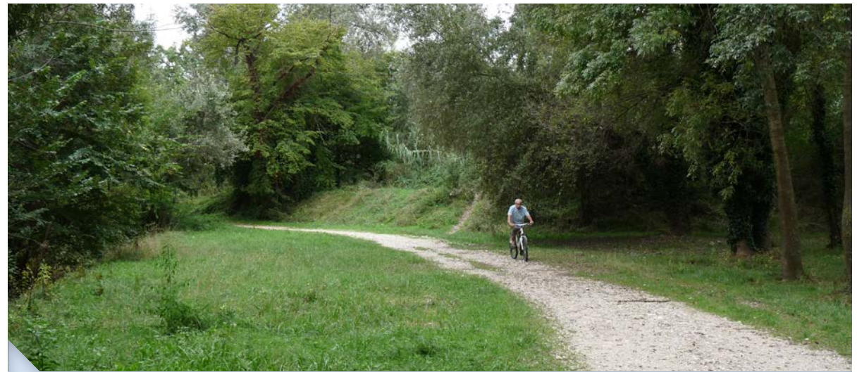
Diagnostic des usages