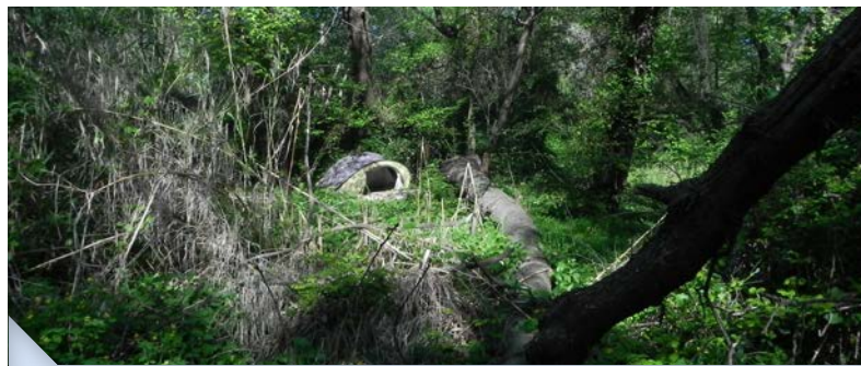
Camping sauvage sur le site