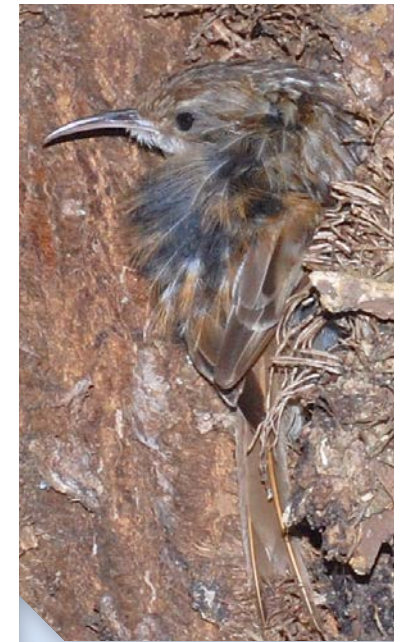
Nidification d'un Grimpeur des jardins entre l'écorce et le lierre