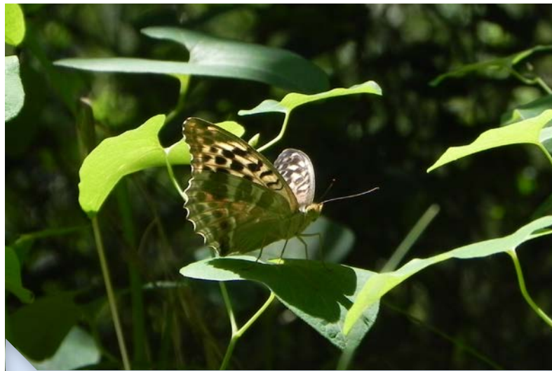
Tabac d'Espagne © Cécile LEMARCHAND

Synthèse bibliographique et compilations des données disponibles, étude foncière, étude réglementaire, inventaires naturalistes faune et flore, cartographie des habitats et des habitats d'espèces, rédaction de l'état initial du site, analyse de l'état de conservation du site et synthèse des enjeux naturalistes, diagnostic des usages sur le site, diagnostic socio-économique, rédaction du plan de gestion.