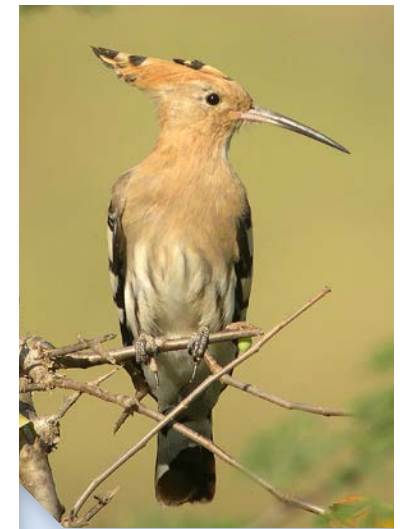
Hupe fasciée