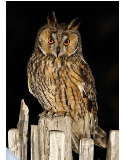
Hibou moyen-duc