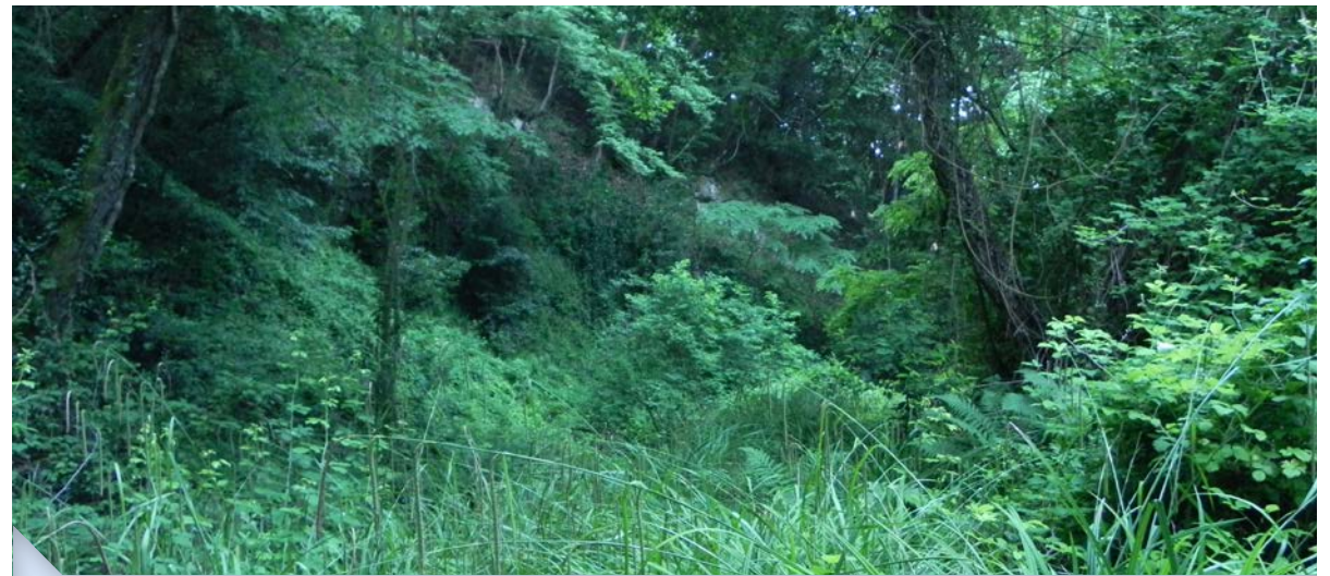
Vallon des Tenchurades