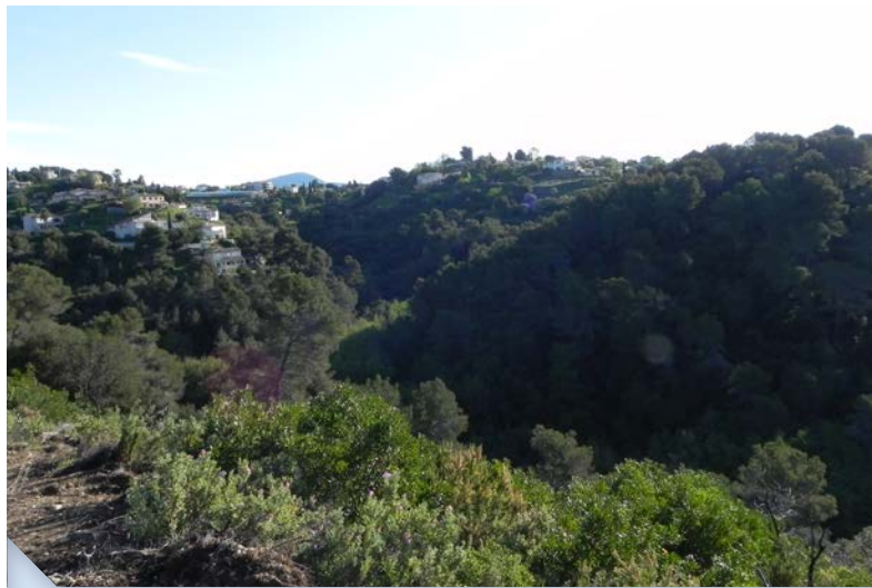
Sommet du vallon des Tenchurades

Synthèse bibliographique et compilations des données disponibles, étude foncière, étude réglementaire, inventaires naturalistes faune et flore, cartographie des habitats et des habitats d'espèces, rédaction de l'état initial du site, analyse de l'état de conservation du site et synthèse des enjeux naturalistes, diagnostic des usages sur le site, diagnostic socio-économique, proposition de scénarii de gestion du site, rédaction du plan de gestion.