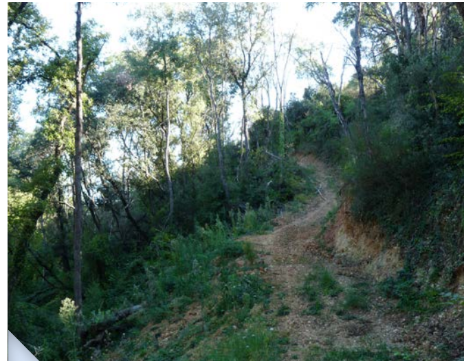
Accès au site

Synthèse des enjeux de conservation de la biodiversité