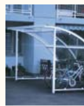
Garage à vélos