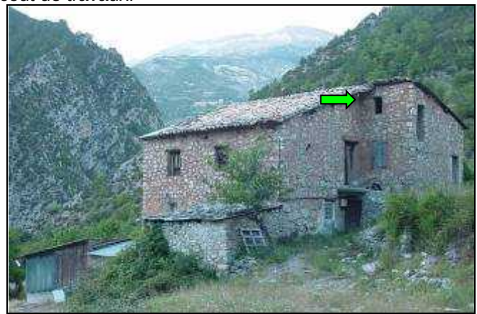
Accès des Petit rhinolophes