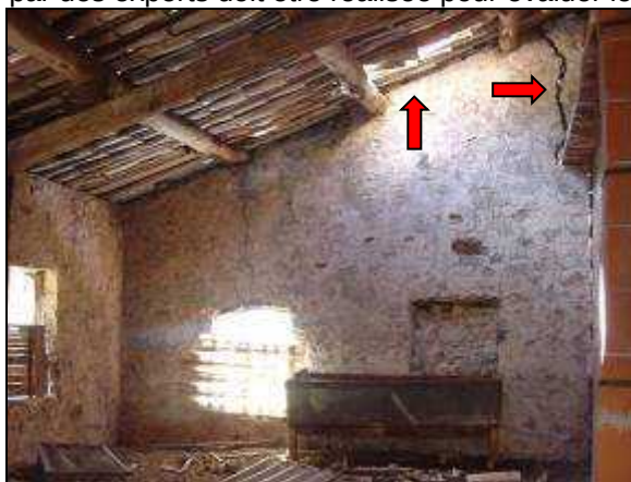
Exemple de trous et fissures dans le bâtiment

Aménagement : Une convention avec le propriétaire est à prévoir pour concilier présence des chauves-souris et utilisation par le berger. Si des travaux de restauration sont prévus, il est possible de réserver des espaces aux Petit rhinolophes afin de conserver la colonie. Les réparations urgentes à réaliser sont la réfection partielle de la toiture et la consolidation de certains murs. Une expertise par des experts doit être réalisée pour évaluer le coût de travaux.