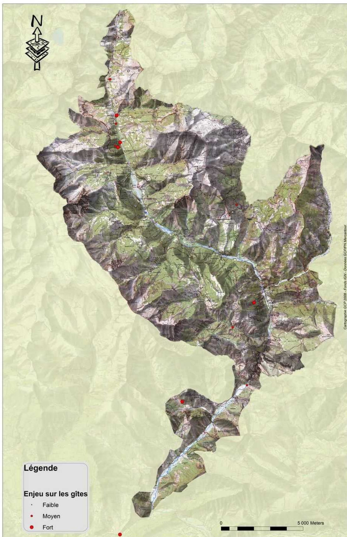
Illustration 2 : localisation des 21 gîtes issus des bases de données