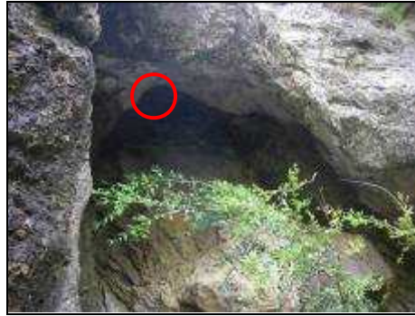
○ Petit rhinolophe