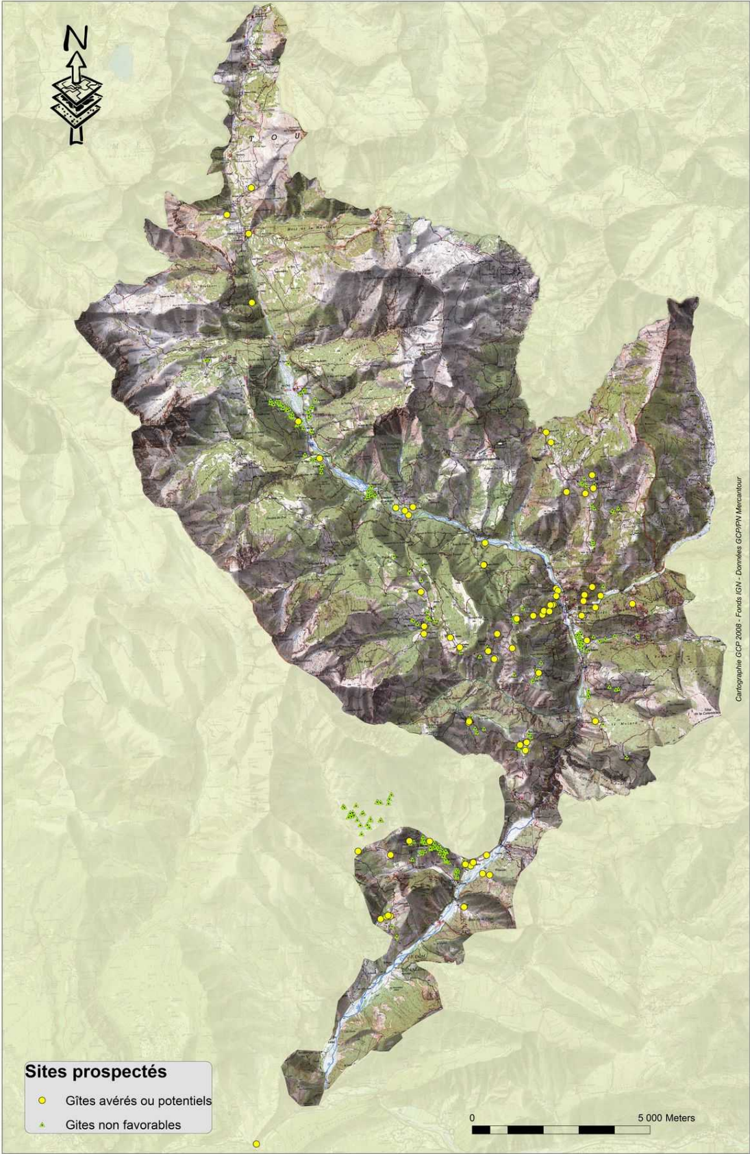
Illustration 1 : localisation des sites prospectés en été 2008