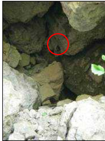
○ Petit rhinolophe