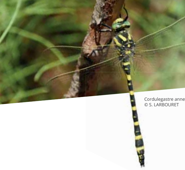
Cordulegastre annelé