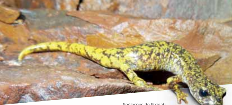
Spéléropès de Strinati