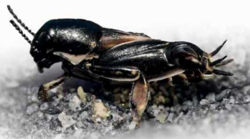
Tridactyle panaché © G. JOUVENEZ